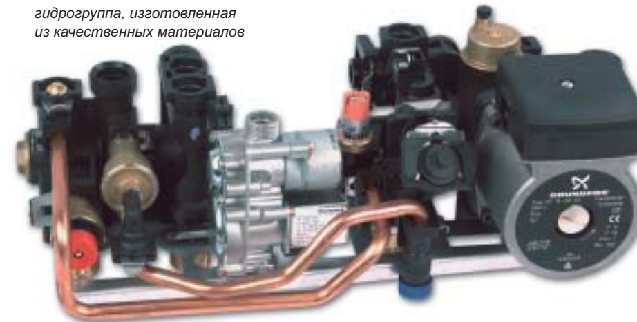
гидрогруппа, изготовленная из качественных материалов

Разработка и производство котлов «PROTHERM» сертифицированы в соответствии с международным стандартом качества ISO 9001.